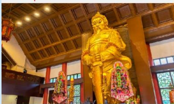
วัดแซกงที่ชื่องกง