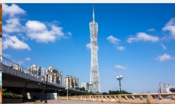
กว้างเจาทาวเวอร์