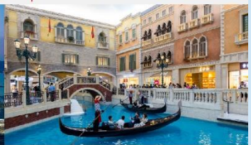
เวเนเซียน

*ทางบริษัทฯ ขอสงวนสิทธิ์ในการสลับโปรแกรมทัวร์ตามความเหมาะสมขึ้นอยู่กับสถานการณ์หน้างาน โดยคำนึงถึงผลประโยชน์ของลูกค้าเป็นสำคัญ