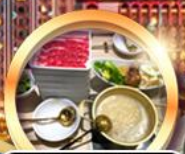
บุฟเฟ่ต์ชาบู เบอร์ม่อน!!