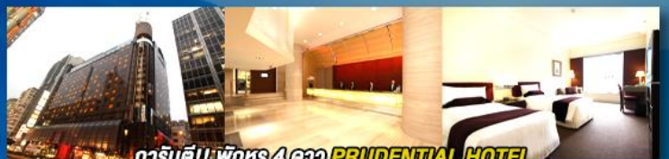
การันตี!! พักหรู 4 ดาว PRUDENTIAL HOTEL ติดถนนนาธาน ย่านช้อปปิ้งจิมซาจอย