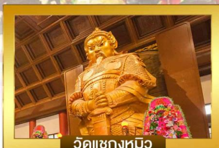
วัดชางทมิว