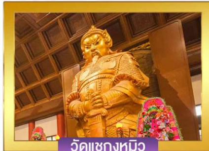
วัดแซงกหมิว