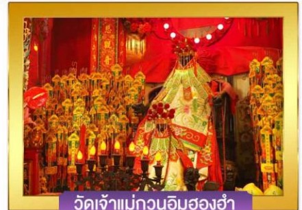
วัดเจ้าแม่กวนอิมสองฮ้า