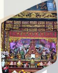
วัดเข้่งเจี๊ง+เทพนากา