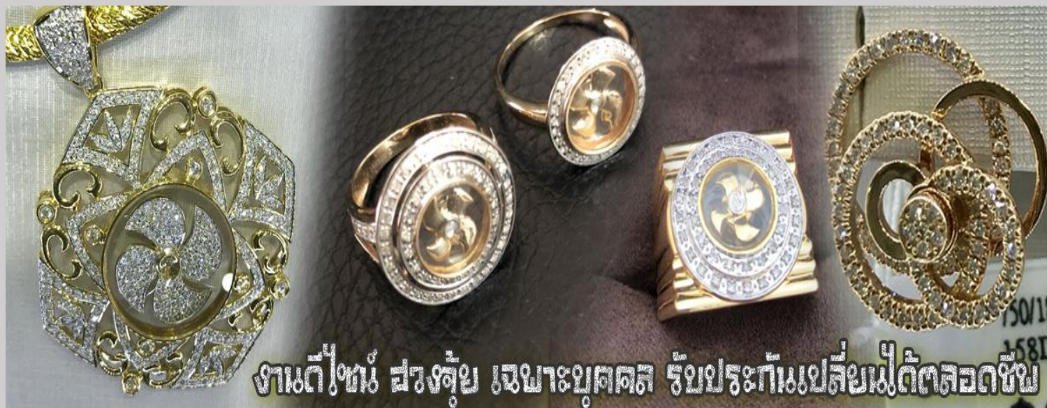
งานดีไซน์ สวยจุ้ย เฉพาะบุคคล รับประกันเปลี่ยนไม่ได้ตลอดชีพ

นำท่านเยี่ยมชม โรงงานจิวเวลรี่ ที่ขึ้นชื่อของฮ่องกงพบกับงานดีไซน์ที่ได้รับรางวัลอันดับยอดเยี่ยม และใช้ในการเสริมดวง เรื่อง ฮวงจุ้ยนำความโชดดี มั่งคั่งแก่ผู้สวมใส่ ซึ่งในเมืองไทยก็ได้นิยมแพร่หลายออกไป ไม่ว่าจะเป็นกลุ่ม ดารา นักการเมือง พ่อค้าแม่ขายที่ประกอบธุรกิจ เจ้าของกิจการห้างร้านต่าง ๆ ซึ่งเชื่อกันว่าจะนำสิ่งดี ๆ ปัดเป่าสิ่งชั่วร้ายให้กับบุคคลที่สวมใส่ ซึ่ง จะมีมากมายหลายชนิด เช่นจี้กั้งหัน แหวนรุ่นต่าง ๆ นาฬิกาข้อมือ (ซึ่งผู้สวมใส่จะได้รับการดูลายมือจากซินเซปประจำร้าน เพื่อ แนะนำวิธีการเสริมดวงในการสวมใส่โดยไม่ได้ค่าบริการ)