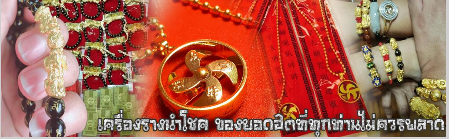
เครื่องรางนำโชค ขลงยอดเยี่ยมที่ทุกท่านไม่ควรพลาด

จากนั้นนำท่านสู่ ร้านหยก ชมความงามปีเซียะ ที่เชื่อกันว่าเป็นวัตถุมงคลยอดนิยม ที่มีการนำมาบูชา เพื่อให้ช่วยป้องกันสิ่งชั่วร้าย เรียกทรัพย์สินเงินทองให้ไหลมาเทมา และกักเก็บทรัพย์นั้นไม่ให้รั่วไหลออกไปไหนได้ ชาวจีนโบราณเชื่อกันว่า ปีเซียะเป็นสัตว์ประหลาดที่รวมลักษณะของสัตว์มงคลทั้ง 5 ชนิดไว้ด้วยกัน ได้แก่ มังกร พญาราชสีห์หรือสิงโต, อินทรี, กวาง, และแมว โดยตามตำนานเล่าว่า ปีเซียะเป็นลูกมังกรตัวที่ 9 (เทพแห่งโชคลาภ) ของพญามังกรสวรรค์ มีชื่อเรียกด้วยกันหลายชื่อไม่ว่าจะเป็น “เทียนลก (กวางสวรรค์)” เป็นชื่อเดิม ส่วนจีนกวางตุ้งจะเรียกว่า “เผ่เฮ้า” และคนจีนแต้จิ๋วจะเรียกว่า “ผีซิว”