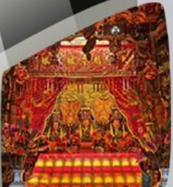
เจ้าแม่ทับทิม Joss House Bay