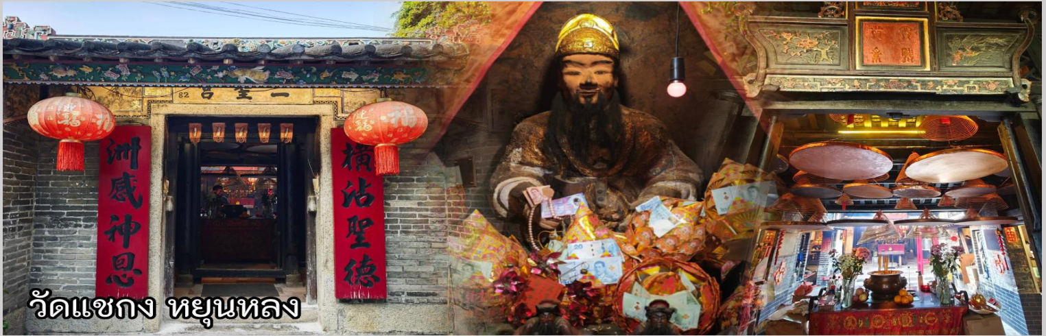
วัดแซกง หยุนหลง

หลังจากนั้นเดินทางสู่เขตหยุนหลง ซึ่งเป็นที่ตั้งขององค์แซกงองค์ดั้งเดิมกว่า 600 ปี I Shing Temple ซึ่งในมือถือขวานเป็นอาวุธ