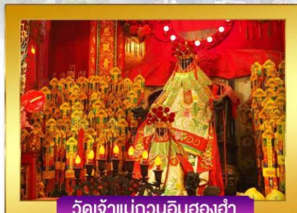
วัดเจ้าแม่กวนอิมฮองฮำ