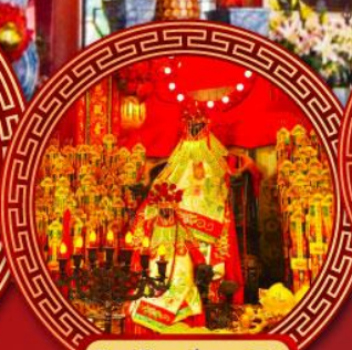
วัดเจ้าแม่กวนอิมฮ่องกง