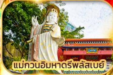
แม่กวนอิมหาดรีพลัสเบย์