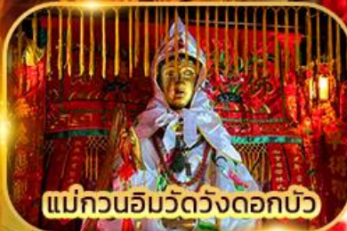
แม่กวนอิมวัดวังดอกบัว