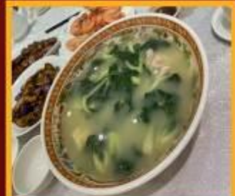
ซุปรกใส่หมู