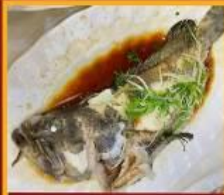
ปลานึ่งซีอิ๊ว