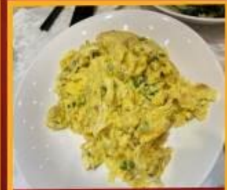
ไข่เจียวทรงเครื่อง