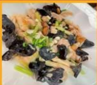
ไก่ผัดเห็ดหูหนู