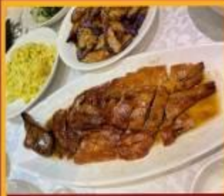
ท่านอย่าง