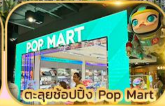
ตะลุยช้อปปิ้ง Pop Mart