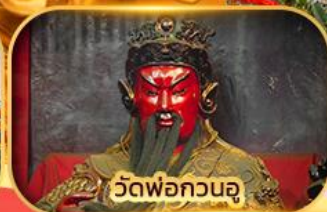
วัดพ่อกวนอู