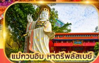
แม่กวนอิม หาดรีฟลิสเบย์