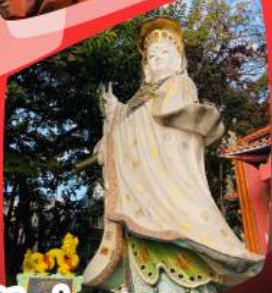
เจ้าแม่กวนอิมรัพลีสินเบ้ง