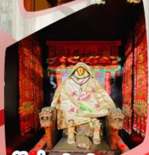
เจ้าแม่กวนอิมหนินฟากง