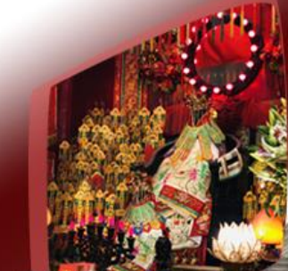
เจ้าแม่กวนอิมจีมเงิน

รหัสโปรแกรม : 38922 (กรุณาแจ้งรหัสโปรแกรมทุกครั้งที่คุณสอบถาม)