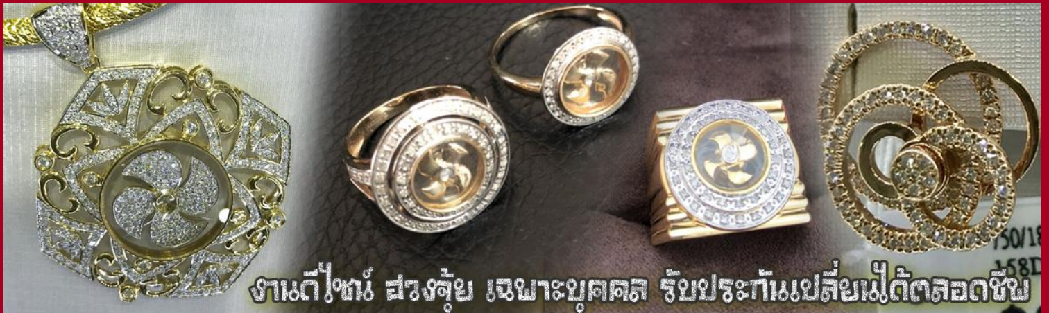
งานดีไซน์ ฮวงจุ้ย เจาะบุศตล รับประกันแบบสี่เหลี่ยมตัดตลอดชีพ

นำท่านเยี่ยมชม โรงงานจิวเวลรี่ ที่ขึ้นชื่อของฮ่องกงพบกับงานดีไซน์ที่ได้รับรางวัลอันดับยอดเยี่ยม และใช้ในการเสริมดวงเรื่อง ฮวงจุ้ยนำความโชคดี มั่งคั่งแก่ผู้สวมใส่ ซึ่งในเมืองไทยก็ได้นิยมแพร่หลายออกไป ไม่ว่าจะเป็นกลุ่ม ดารา นักการเมือง พ่อค้าแม่ขายที่ประกอบธุรกิจ เจ้าของกิจการห้างร้านต่าง ๆ ซึ่งเชื่อกันว่าจะนำสิ่งดี ๆ ปัดเป่าสิ่งชั่วร้ายให้กับบุคคลที่สวมใส่ ซึ่งจะมีมากมายหลายชนิด เช่น จี้กั๊กทัน แหวนรุ่นต่าง ๆ นาฬิกาข้อมือ (ซึ่งผู้สวมใส่จะได้รับการดูลายมือจากซินแซประจำร้าน เพื่อแนะนำวิธีการเสริมดวงในการสวมใส่โดยไม่ติดต่อบริการ)