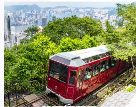
รถรางพิกแคธเม