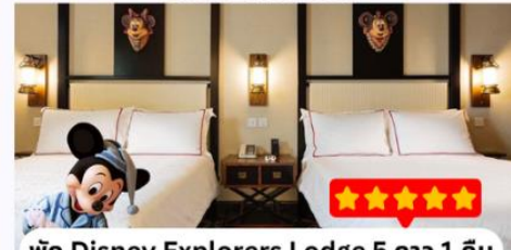
พัก Disney Explorers Lodge 5 ดาว 1 คืน