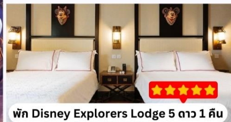
พัก Disney Explorers Lodge 5 ดาว 1 คืน