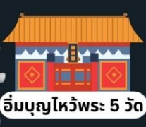
อิมบุนยไหว้พระ 5 วัด