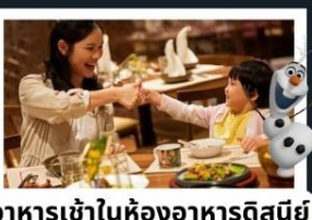
อาหารเข้าในห้องพักดิสนีย์