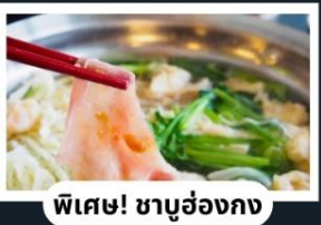
พิเศษ! ชาบูฮ่องกง

พักรูในดิสนีย์แลนด์ 1 คืน พร้อมบัตรเครื่องเล่นแบบจุใจ