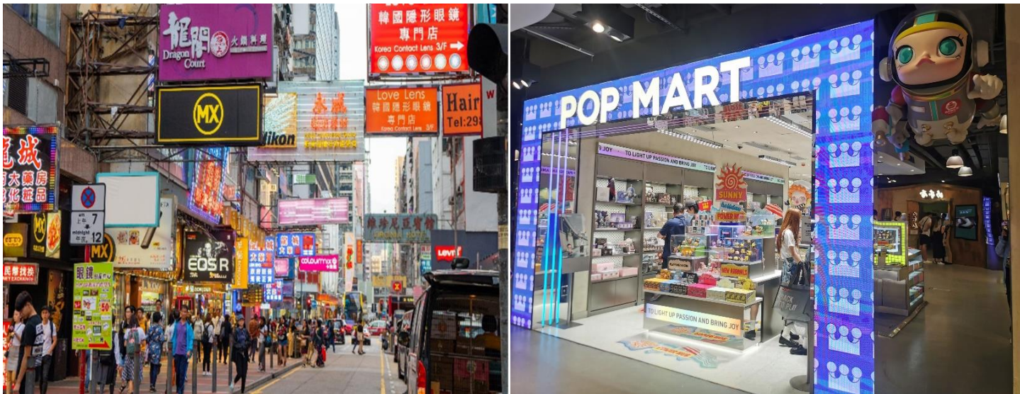
โรงแรมใจกลางย่านมงก๊ก ด้านล่างโรงแรมเป็น Temple Street Night Market