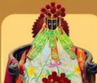
เจ้าแม่กวนอิมสองฮ่า