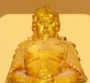
วัดแซงกหนิว