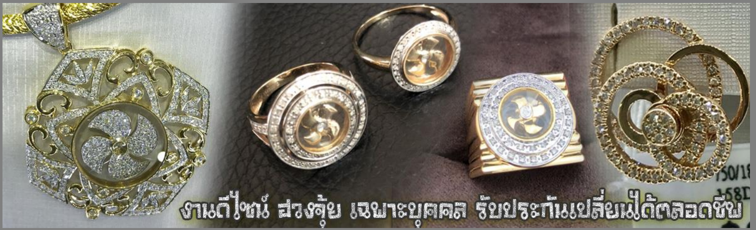
งานตีไซ้ ฝรั่งชุบ เหนาะบุคคล รับประกันเปลี่ยนไม่ได้ตลอดชีพ

จากนั้นนำท่านสู่ ร้านหยก ชมความงามปีเซียะ ที่เชื่อกันว่าเป็นวัตถุมงคลยอดนิยม ที่มีการนำมาบูชา เพื่อให้ช่วยป้องกันสิ่งชั่วร้าย เรียกทรัพย์เงินทองให้ไหลมาเทมา และกักเก็บทรัพย์นั้นไม่ให้รั่วไหลออกไปไหนได้ ชาวจีนโบราณเชื่อกันว่า ปีเซียะเป็นสัตว์ประหลาดที่รวมลักษณะของสัตว์มงคลทั้ง 5 ชนิดไว้ด้วยกัน ได้แก่ มังกร พญาราชสีห์หรือสิงโต, อินทรี, กวาง, และแมว โดยตามตำนานเล่าว่า ปีเซียะเป็นลูกมังกรตัวที่ 9 (เทพแห่งโชคลาภ) ของพญามังกรสวรรค์ มีชื่อเรียกด้วยกันหลายชื่อไม่ว่าจะเป็น “เทียนลก (กวางสวรรค์)” เป็นชื่อเดิม ส่วนจีนกวางตุ้งจะเรียกว่า “เผ่เย้า” และคนจีนแต้จิ๋วจะเรียกว่า “ผีซิว”