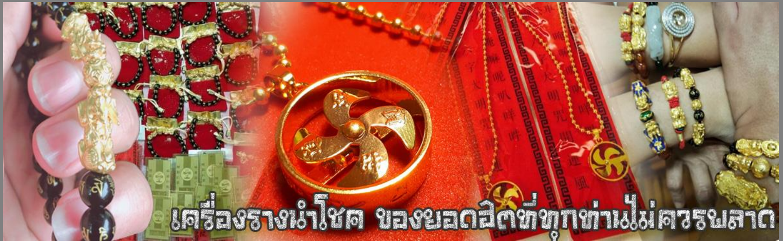
เครื่องรางนำโชค ของยอดสิทธิ์ทุกท่านไม่ควรมองข้าม

จากนั้นนำท่านสู่ ร้านหยก ชมความงามปีเซียะ ที่เชื่อกันว่าเป็นวัตถุมงคลยอดนิยม ที่มีการนำมาบูชา เพื่อให้ช่วยป้องกันสิ่งชั่วร้าย เรียกทรัพย์เงินทองให้ไหลมาเทมา และกักเก็บทรัพย์นั้นไม่ให้รั่วไหลออกไปไหนได้ ชาวจีนโบราณเชื่อกันว่า ปีเซียะเป็นสัตว์ประหลาดที่รวมลักษณะของสัตว์มงคลทั้ง 5 ชนิดไว้ด้วยกัน ได้แก่ มังกร พญาราชสีห์หรือสิงโต, อินทรี, กวาง, และแมว โดยตามตำนานเล่าว่า ปีเซียะเป็นลูกมังกรตัวที่ 9 (เทพแห่งโชคลาภ) ของพญามังกรสวรรค์ มีชื่อเรียกด้วยกันหลายชื่อไม่ว่าจะเป็น “เทียนลก (กวางสวรรค์)” เป็นชื่อเดิม ส่วนจีนกวางตุ้งจะเรียกว่า “เผ่เย้า” และคนจีนแต้จิ๋วจะเรียกว่า “ผีซิว”