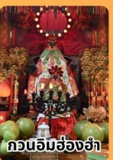
กวนอิมฮ่องกง