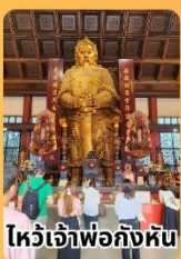
ไหว้เจ้าพ่อก้งหั้น