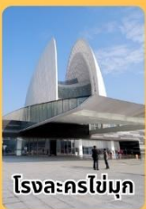
โรงละครโมเดิร์น