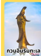
กวนอิมริมทะเล

เมนูพิเศษ *ชาบูบุฟเฟ่ต์ *ข้าวต้มหม้อดิน *เปิดย่าง *ไอศกรีมทรงรอบ