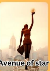
Avenue of star