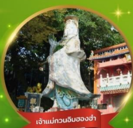
เจ้าแม่กวนอิมสองอำ