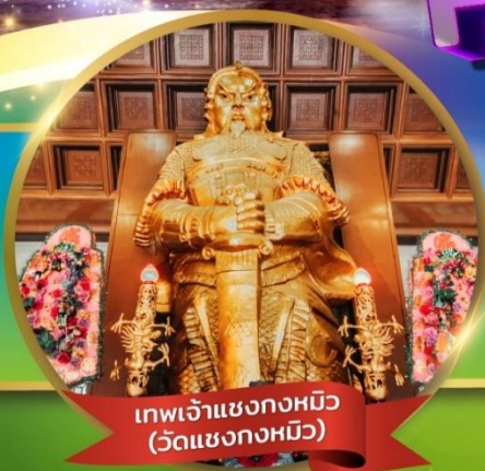
เทพเจ้าเขangkงหมิว (วัดเขangkงหมิว)