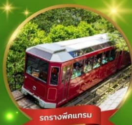
รถรางพิศกรรม