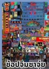
ช้อปปิ้งจางจ๋วย