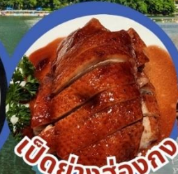
เป็ดย่างฮ่องกง