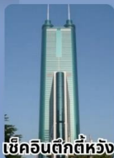
เซ็คอินตึกตีหว่ง