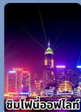
ชมไฟนีออนฟโลร์