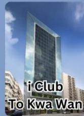
i Club To Kwa Wan

คอนเฟิร์มเดินทาง พฤศจิกายน 2567 2-4 / 9-11 / 16-18 23-25 / 30 พ.ย. - 2 ธ.ค.