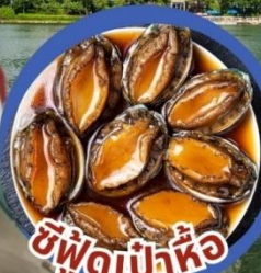
ซีฟู้ดเป่าหื้อ