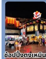
ช้อปปิ้งตงเหมิน