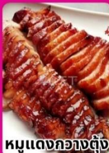
หมูแดงกวางตุ้ง