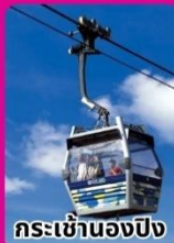
กระเช้านองปีง