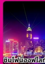
ชมไฟนีออนไฟโล่