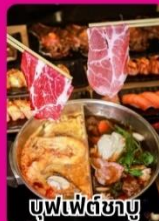
บุฟเฟ่ต์ซาบู