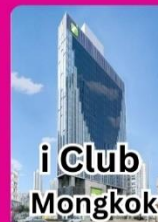
i Club Mongkok