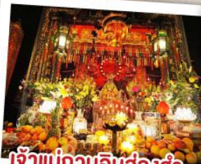
เจ้าแม่กวนอิมฮ้องฮำ