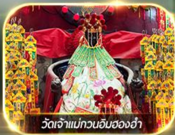
วัดเจ้าแม่กวนอิมสองฮ่า