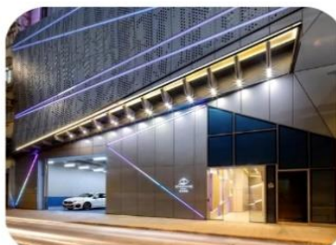
Starphire Hotel (มงก๊ก)