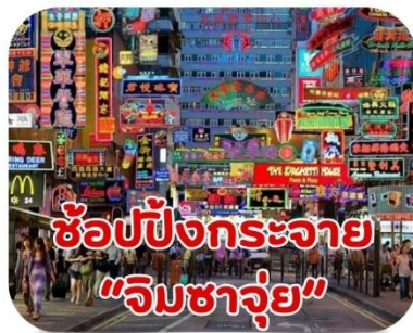
ช้อปปิ้งกระจาย "จิมซาจุ่ย"