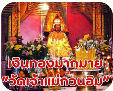
เงินทองมากมาย "วัดเจ้าแม่กวนอิม"