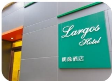
Lagos Hotel (จอร์แดน)