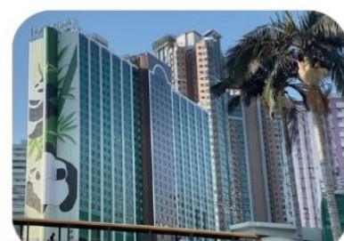
Panda Hotel (ซุนหวาน)