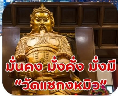
มั่นคง มั่งคั่ง มั่งมี "วัดเซกวงหมิว"