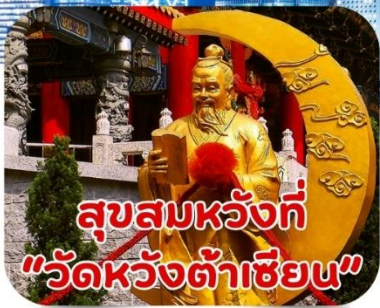
สุขสมหวังที่ "วัดหวังต้าเซียน"

แพ็คเกจทัวร์ฮ่องกง 3 วัน 2 คืน ที่คุ้มค่าที่สุดสุดในสามโลก