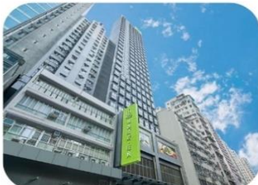
Ease Mongkok Hotel (มงก๊ก)