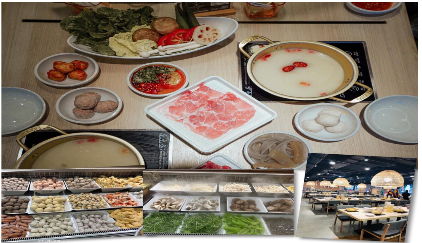
เพียง รับประทานอาหารเที่ยง ณ ภัตตาคาร (5) เมนูชาบู