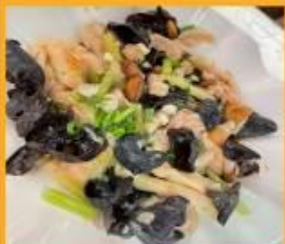
ไก่ผัดเห็ดหูหนู