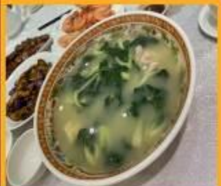
ซุปร้อนใส่หมู