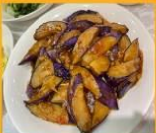
มะเขืออบหม้อดิน