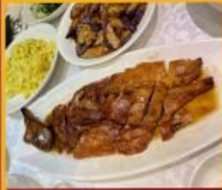
ท่านอย่าง