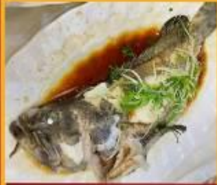
ปลาหนึ่งซีอิ้ว