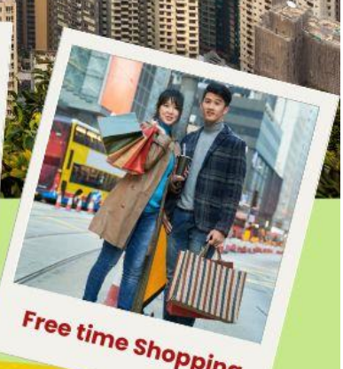
Free time Shopping