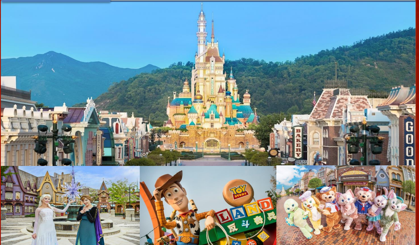
Option: Disneyland (ไม่รวมค่าเดินทาง)