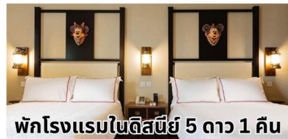
พักโรงแรมในดิสนีย์ 5 ดาว 1 คืน