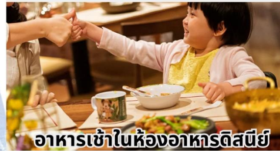
อาหารเข้าในห้องพักดิสนีย์