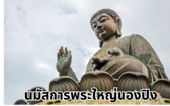
นมัสการพระใหญ่ของปิง