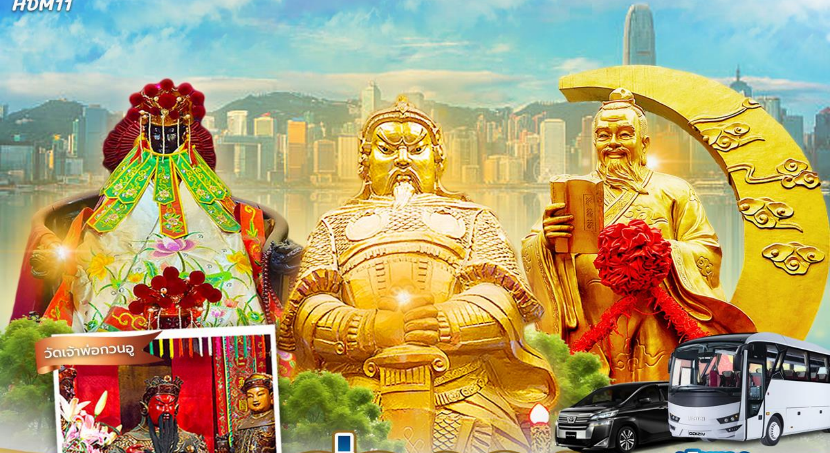
วัดเจ้าพ่อกวนอู