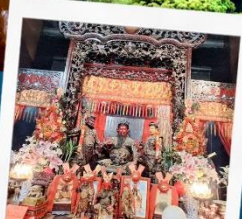
เทพเจ้ากวนอู วัดกวนไท