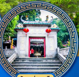
วัดอามา มาเก๊า