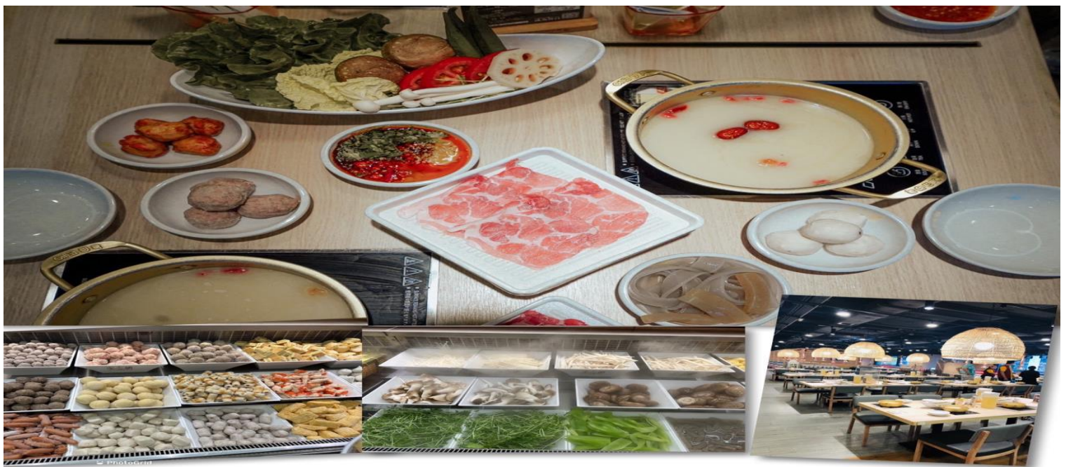
เที่ยง รับประทานอาหารเที่ยง ๑๐ (3) เมนูชาบู