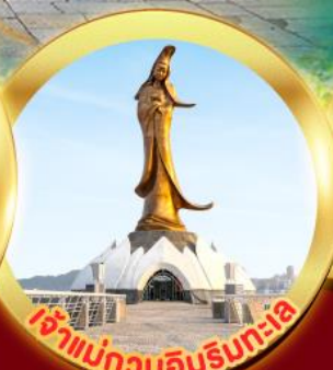
เจ้าแม่ทวนอิมรินทะเอ