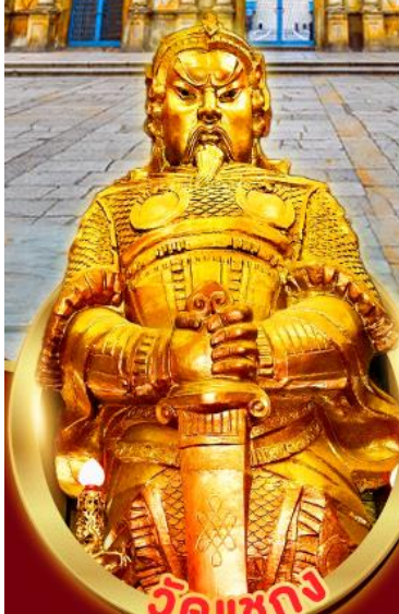
วัดแซกซง