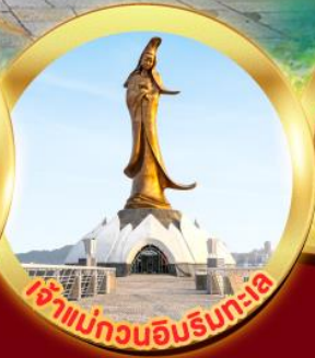
เจ้าแม่ทวนอิมริมทะเล