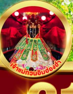
เจ้าแม่ทวนอิมฮ่องฮัก