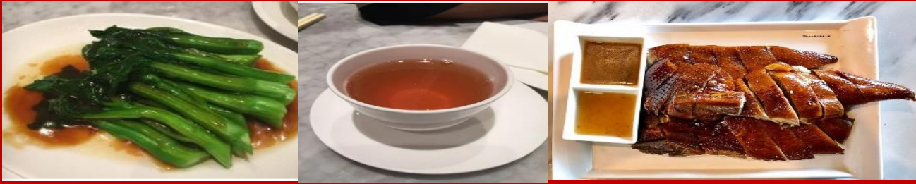
กลางวัน ๑๐ บริการอาหารกลางวัน ณ ภัตตาคาร...พิเศษ เมนู ทำอย่างเลิศรส ต้นตำหรับฮ่องกง

วันที่ 2 ของเดือนแรกตามปฏิทินจีนชาวฮ่องกงและนักท่องเที่ยวจะมาวัดนี้เพื่อถวายกังหันลมเพราะเชื่อว่ากังหันจะ ช่วยพัดพาสิ่งชั่วร้ายและโรคภัยไข้เจ็บออกไปจากตัวและนำพาแต่ความ โชคดีเข้ามาแทน