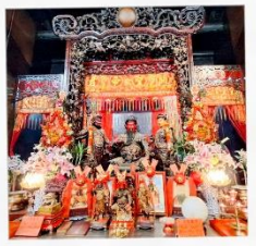
วัดเทพเจ้ากวนอู