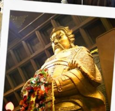
วัดเชกงคมิว