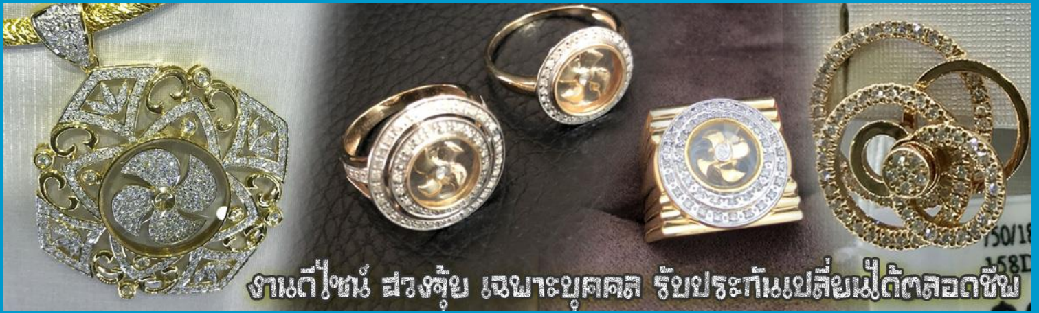
งานตีไข่มุก ฝังจัญไร เหนาะบุคคล รับประกันเปลี่ยนเมื่อใดตลอดชีพ

จากนั้นนำท่านสู่ ร้านหยก ชมความงามปีเซียะ ที่เชื่อกันว่าเป็นวัตถุมงคลยอดนิยมน ที่มีการนำมาบูชา เพื่อให้ช่วยป้องกันสิ่งชั่วร้าย เรียกทรัพย์สินเงินทองให้ไหลมาเทมา และกักเก็บทรัพย์นั้นไม่ให้รั่วไหลออกไปไหนได้ ชาวจีนโบราณเชื่อกันว่า ปีเซียะเป็นสัตว์ประหลาดที่รวมลักษณะของสัตว์มงคลทั้ง 5 ชนิดไว้ด้วยกัน ได้แก่ มังกร พญาราชสีห์หรือสิงโต, อินทรี, กวาง, และแมว โดยตามตำนานเล่าว่า ปีเซียะเป็นลูกมังกรตัวที่ 9 (เทพแห่งโชคลาภ) ของพญามังกรสวรรค์ มีชื่อเรียกด้วยกันหลายชื่อไม่ว่าจะเป็น “เทียนลก (กวางสวรรค์)” เป็นชื่อเดิม ส่วนจีนกวางตุ้งจะเรียกว่า “เผ่เฮ้า” และคนจีนแต้จิ๋วจะเรียกว่า “ผีซิว”