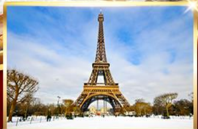
ทานอาหารกลางวันบนหอไอเฟล