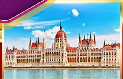
ชมอาคารรัฐสภาที่สวยงามที่สุดของยุโรป