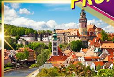
เดินชมเมือง เซสกี คุลมุลอฟ

มิดัน • โอเมอรามา • เจกัท เจ้าชมปราสาทนอยชวานส์ตัน • โรเซนโฮม • ซอลส์เบิร์ก วัลส์สตัดท์ • ลินซ์ • เซสกี คุลมุลอฟ • ปราสาทครุมลอฟ กรุงปารีส • ปราสาทปารีส • สะพานชาร์ลส์ หอนาฬิกาตาราซาสต์ • บราติสลาวา • กรุงเวียนนา พระราชวังเฮินบรุนน์ (ภายนอก) • สวนสาธารณะสตัดปาร์ค ถนนคาร์ทเนอร์ • OUTLET PARNDORF • กรุงบูดาเปสต์ คาสเซิลฮิลล์ • ซีรีส์แควร์ • ล่องเรือชมวิวทิวทัศน์สองฟากฝั่งแม่น้ำดานูบ