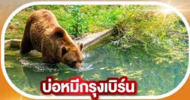
บ่อหมีกรุงเบิร์น