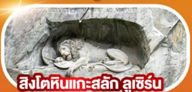
สิงโตหินแกะสลัก ลูเซิร์น