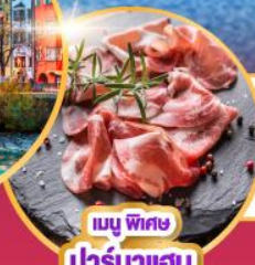
เมนู พิเศษ