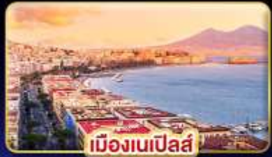
เมืองเนเปิลส์