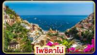
โพซิตาโน