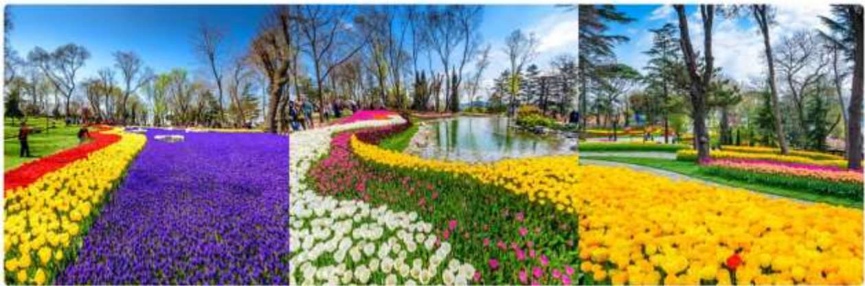
*ภาพเพื่อการโฆษณาเท่านั้น

นำทุกท่านเข้าชม สวนดอกทิวลิป (เทศกาลดอกทิวลิปเปิดให้เข้าชมระหว่างวันที่ 1-30 เมษายนเท่านั้น) สวนดอกทิวลิปหลากสีหลายสายพันธุ์นับล้านดอกที่สวยงามที่สุด และมีชื่อเสียงที่สุดของตุรกี ตลอดเดือนเมษายน เทศกาลทิวลิปอีสตันบูล เป็นเทศกาลประจำปี โดยจะจัดในช่วง 3 สัปดาห์สุดท้ายของเดือนเมษายน เพื่อเฉลิมฉลอง ทั้งฤดูใบไม้ผลิ และความสำคัญของดอกทิวลิป ที่มีต่ออาณาจักรออตโตมัน และวัฒนธรรมตุรกี ปกติแล้วเทศกาลนี้ จัดขึ้นที่สวนสาธารณะ ที่มีชื่อเสียงที่สุดของเมือง ให้ทุกท่านได้ถ่ายรูปตามอัธยาศัย