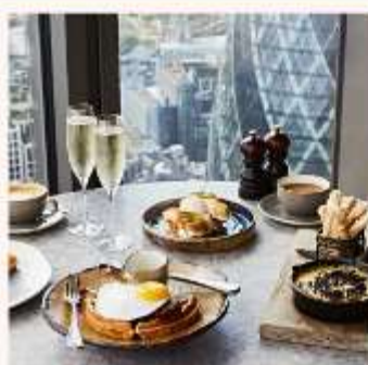
DUCK AND WAFFLE