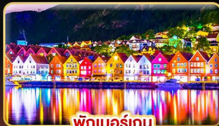
พักเบอร์เกน