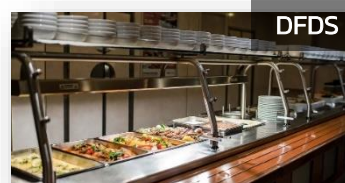
พิเศษ มื้อค่ำ DFDS Buffet Scandinavia