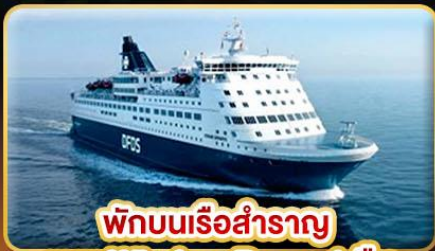
พักบนเรือสำราญ แบบ Window Room 1 คืน