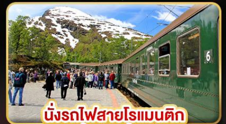
นั่งรถไฟสายโรแมนติก "ฟรอมสปานา"