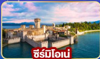
ซีสมีโอนัน