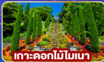
เกาะดอกไม้โมนา