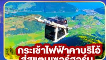
กระเช้าไฟฟ้าคาบรีโอ สู่สแตนเซอร์ฮอร์น

พิเศษ! พิซชียอดเขาติอาโวลีซา พร้อมเมนูกะเพราไทย