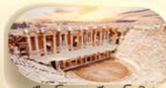
เมืองโบราณเฮียราโพลิส

16-24 พ.ค.68 20-28 มิ.ย.68 26 ก.ค. - 3 ส.ค.68 9-17 ส.ค.68 12-20 ก.ย.68 10-18 ต.ค.68 18-26 ต.ค.68