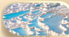
ปราสาทปุยฝ้าย