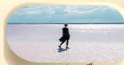
ทะเลสาบเกลือ