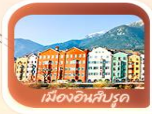
เมืองอินส์บรุค