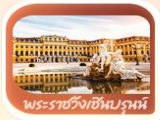
พระราชวังเชินบรุนน์