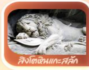
สิงโตหินแกะสลัก