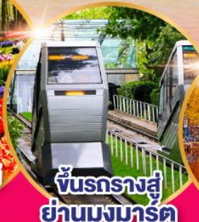
ชั้นรถรางสู่ ย่านมงมาร์ต