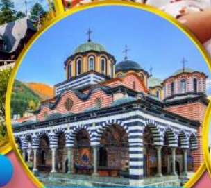
อารามมรดกโลกริลา