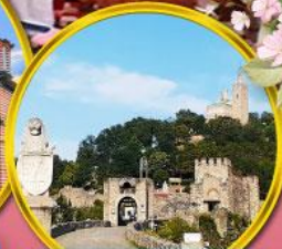
ป้อมชาเรเวทส์