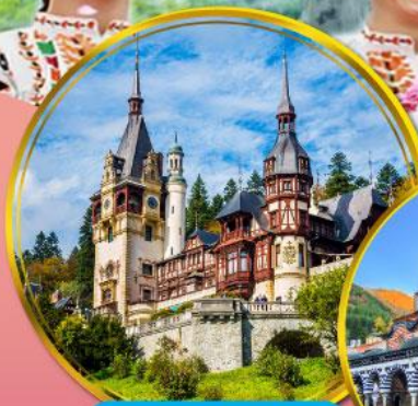
ปราสาทเปเลส